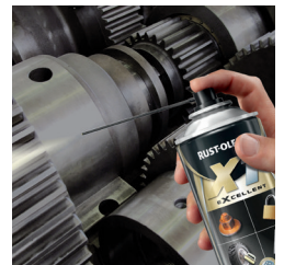
SCHMIERUNG UND REINIGUNG